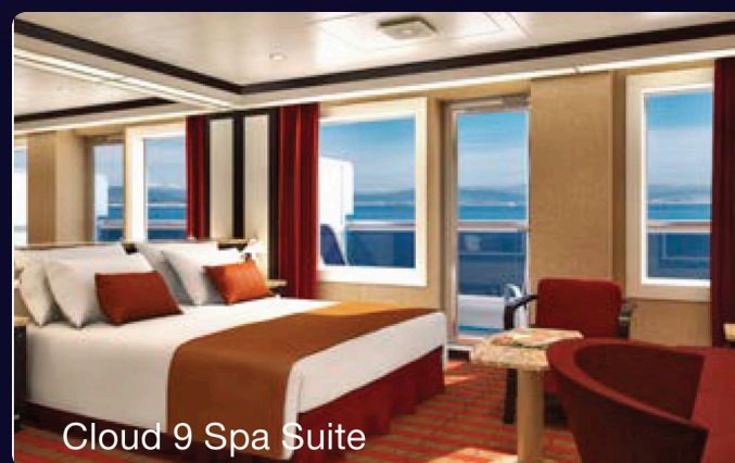
Spa Suite Room

Тусгай Cloud 9 spa тасагт орох эрхтэй Тансаг өрөө