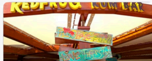
RedFrog Rum Bar