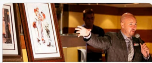
Урлагийн дуудлага худалдаа