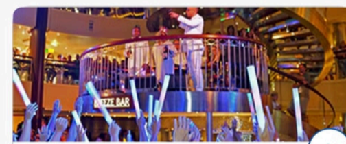
Цагаан халуун шөнийн үдэшлэг