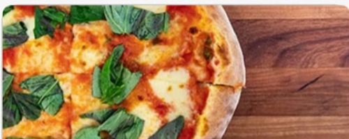
Пиццери дель Капитано